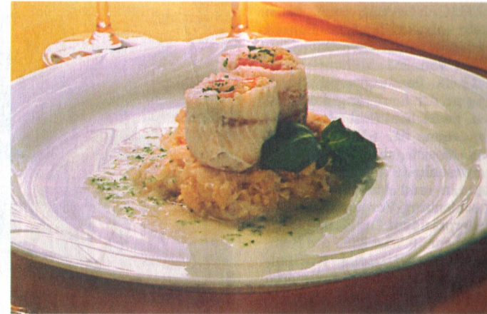
Leicht, bekömmlich und köstlich: Königsbarschroulade mit Shrimps auf Sauerkraut.

600 g Königsbarschfilet, 100 g Shrimps; pures Fleisch, 100 g Zwiebel; in Streifen geschnitten und geschmolzen; 50 g getrocknete Italo-Tomaten, 1 Bund Schnittlauch, 1 Zitrone, Salz, Pfeffer, etwas Cayenne, 500 g Sauerkraut; lauwarm waschen und ausdrücken, 1,0 l Sauerkrautsaft, evtl. mit 1 Messerspitze Johannisbrotkernmehl kalt anrühren, 1 saurer Apfel (Granny Smith), gerieben, 0,2 l Kaffeesahne (0,2 % Fett), 0,2 l trockener Weißwein, etwas Johannisbrotkernmehl, 100 g Zwiebeln; in Streifen geschnitten und geschmolzen, 2 Knoblauchzehen, 2 Lorbeerblätter und Nelken, 2 gespickte Zwiebeln, Salz, Pfeffer, etwas Süßstoff.